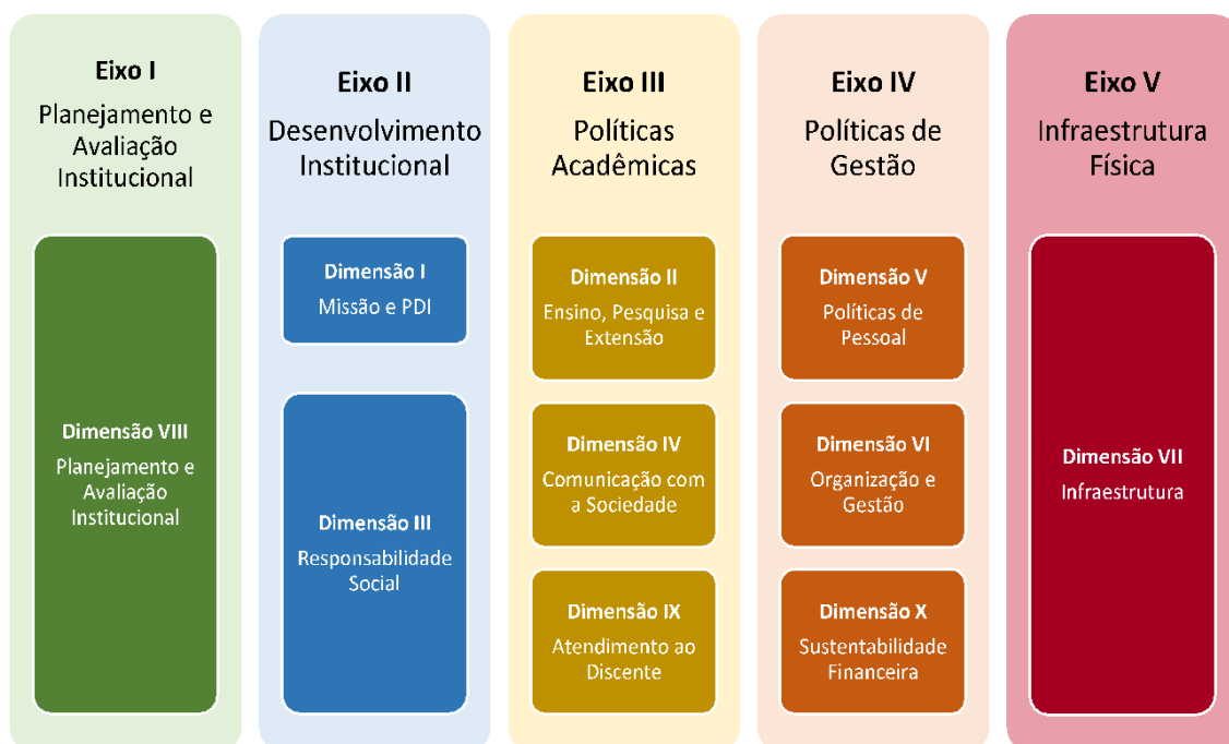
Figura 2 – Eixos e dimensões do SINAES

Essa autoavaliação, realizada em todos os cursos da IES, a cada semestre, de forma quantitativa e qualitativa, atenderá à Lei do Sistema Nacional de Avaliação da Educação Superior (SINAES), nº 10.8601, de 14 de abril de 2004. A legislação irá prever a avaliação de dez dimensões, agrupadas em 5 eixos, conforme ilustra a figura a seguir.