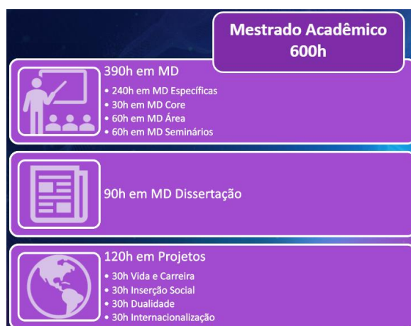
Figura 2 – Integralização do Currículo.

A integralização do currículo de mestrado, totalizando 600 horas, se dá a partir da participação em três grupos de atividades (figura 2). O primeiro grupo se refere a unidades curriculares desenhadas para o Mestrado, totalizando 390 horas. O segundo grupo se refere a atividades de investigação que culminam com a elaboração da dissertação, totalizando 90 horas. O terceiro grupo se refere à participação do estudante em projetos, totalizando 120 horas.