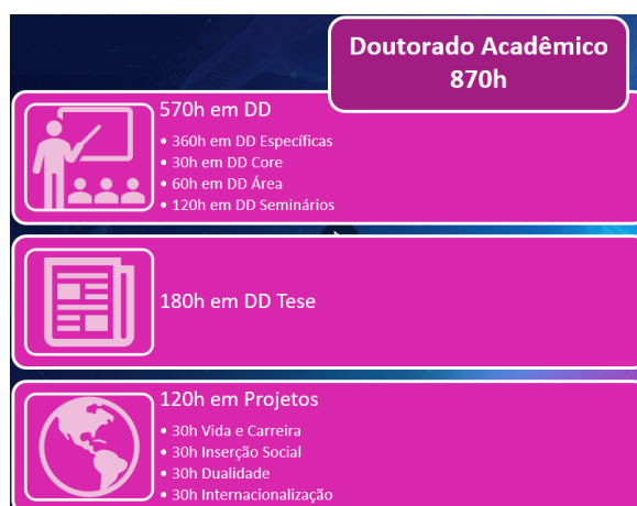
Figura 2 – Integralização do Currículo.

A integralização do currículo de mestrado, totalizando 870 horas, se dá a partir da participação em três grupos de atividades (figura 2). O primeiro grupo se refere a unidades curriculares desenhadas para o Doutorado, totalizando 570 horas. O segundo grupo se refere a atividades de investigação que culminam com a elaboração da tese, totalizando 180 horas. O terceiro grupo se refere à participação do estudante em projetos, totalizando 120 horas.