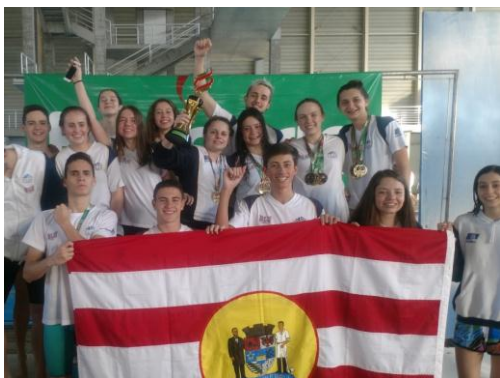
Equipe fez 129 pontos durante a competição

Blumenau e Joinville foram as campeãs da natação da etapa Estadual dos Joguinhos Abertos de Santa Catarina, encerrada neste domingo, dia 16 de julho, no Complexo Aquático da Unisul, em Palhoça. Com as conquistas, as cidades somam pontos importantes para a sequência da competição que tem o seu complemento a partir do dia 22 de julho, em Caçador, com as demais modalidades.