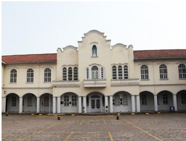
Prédio Sede Unisul

Em março do ano passado, o Diretório Central dos Estudantes de Tubarão (DCE) e a Unisul realizaram um acordo para a concessão de bolsas de estudos a uma parcela de alunos que cursaram – em 2003 – o Campus Universitário de Tubarão e suas Unidades vinculadas (Içara, Laguna, Braço do Norte e Imbituba). O compromisso mútuo resulta do provimento parcial de uma ação proposta pelo Diretório para os estudantes do respectivo ano, substituindo parte dos valores pagos por bolsas de estudos nos cursos da Unisul.