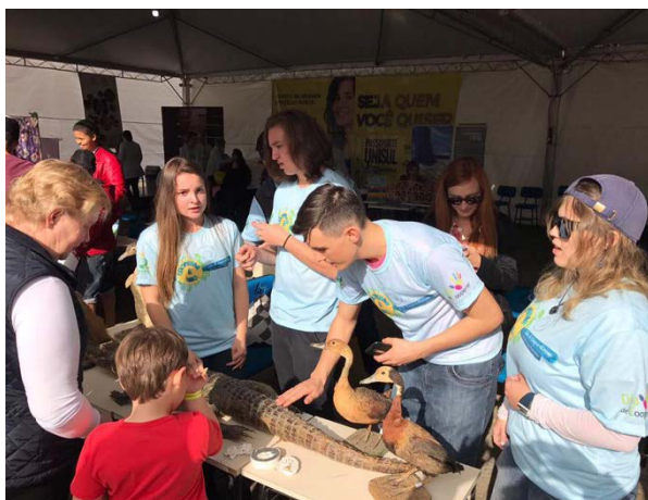
Foto: Dia do Cooperativismo em Braço do Norte em 2017

Um dia voltado para a comunidade. Este é o objetivo de mais uma edição do Dia do Cooperativismo em Braço do Norte, que acontece neste sábado, 7/7, a partir das 9h, na Praça Pe. Roher. A Unisul participará pelo terceiro ano consecutivo do evento, que é uma iniciativa da Cerbranorte. Ao todo, oito cursos da graduação estarão presentes no próximo sábado, além de alguns projetos de extensão.