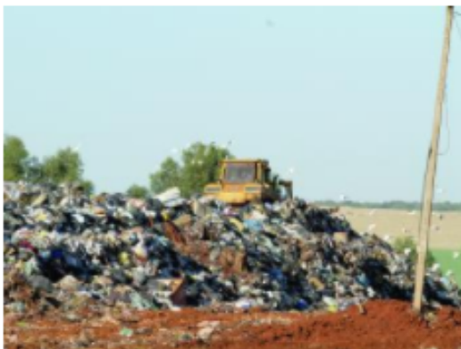
Lixo transformado em energia trouxe economia ao aterro e à prefeitura

A sustentabilidade trouxe além dos cuidados indispensáveis ao meio ambiente, economia aos cofres da Prefeitura de Cascavel. Projeto instalado no aterro municipal transformou lixo em energia e amenizou consideravelmente o valor da conta.